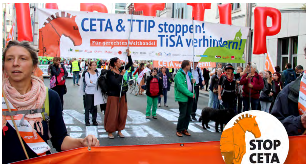
Weitere Impressionen von der Brüsseler Demo auf